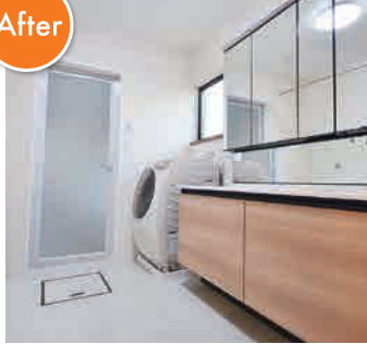
▲ 収納スペースが増え、きれいで清潔な洗面所に生まれ変わった