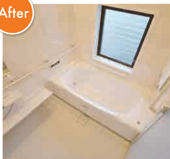
▲ 壁面のスマートエスコートバーに捕まれば、洗い場での立ち・座り動作や、洗い場から浴槽への移動が安全かつラクになる